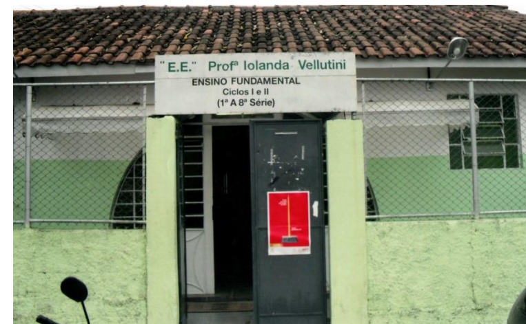
2011 - Sede da Escola de Ensino Fundamental Ciclos I e II