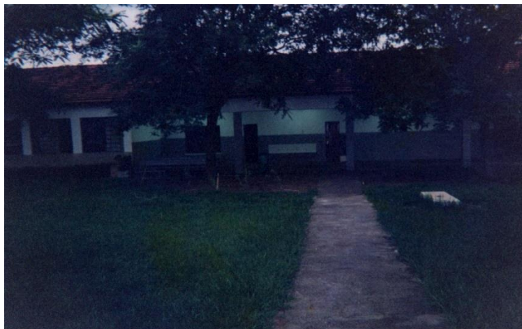
2001 - Sede da Escola Municipal de Educação Infantil