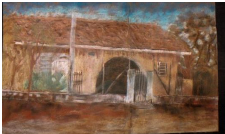
1951 - Sede da Escola Jardim Santa Cecília